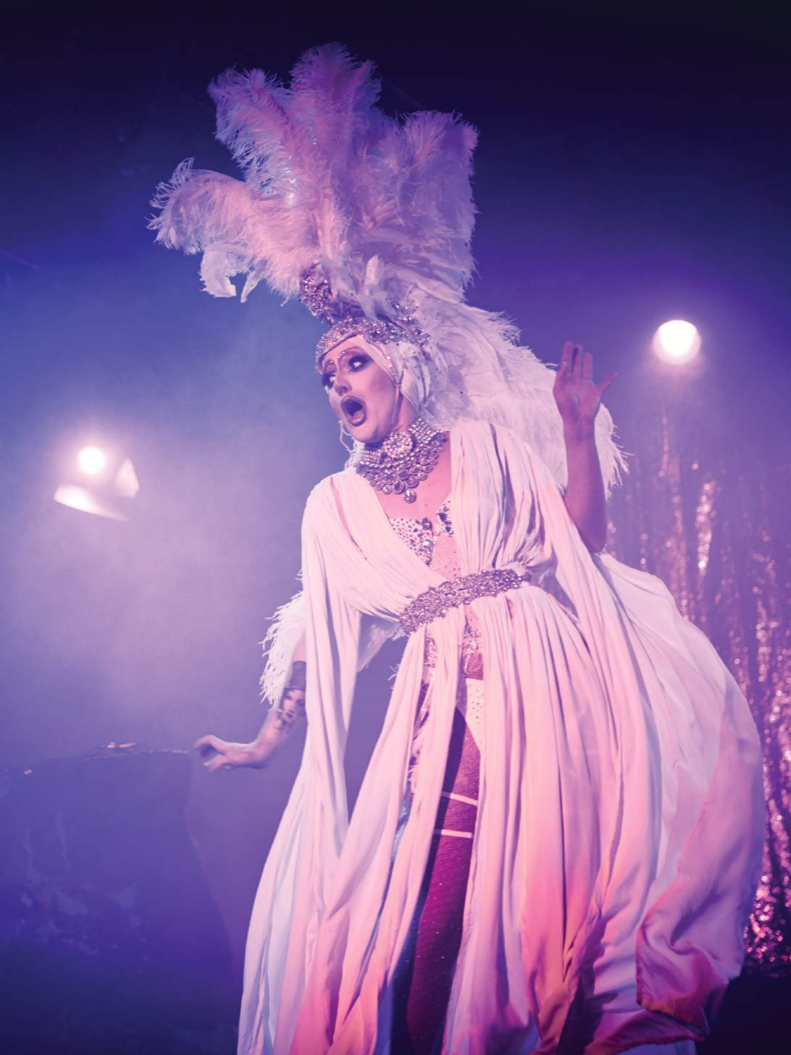
Eva Detox in «Queer Year's Eve»