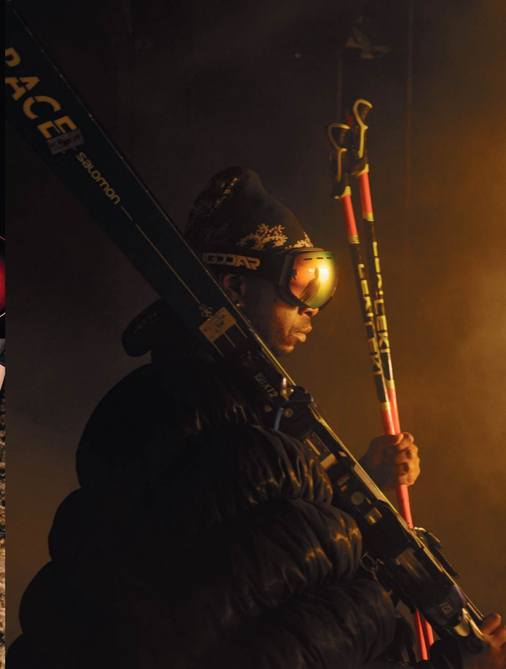
Challenge Gumbodete in «Nightrace in Zürich»